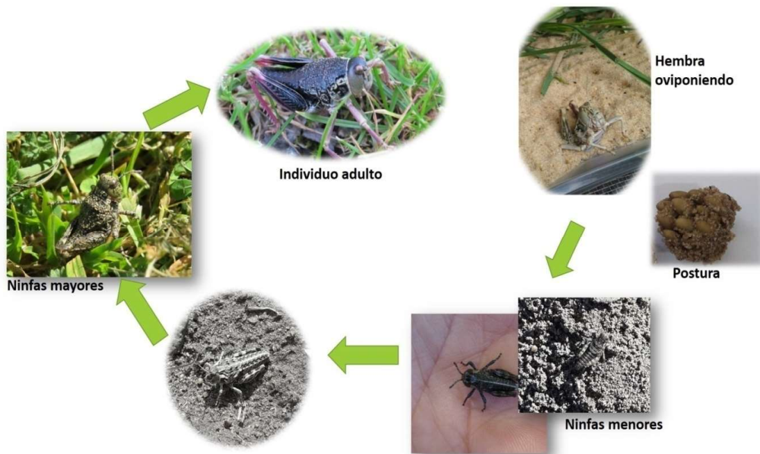
Figura 7. Ciclo de vida general de tucura sapa.